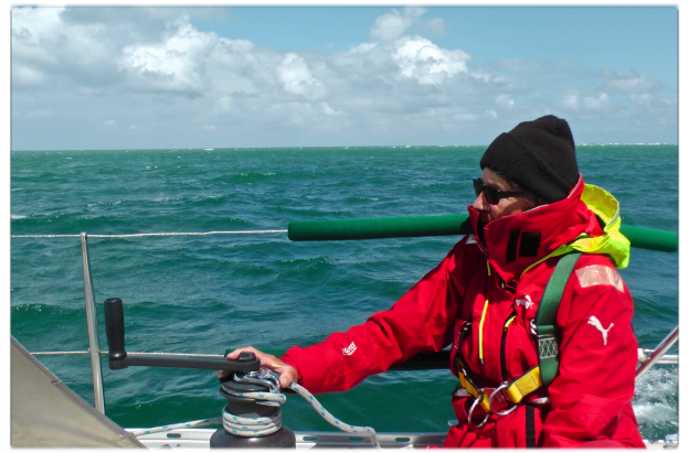
Zwischen Oostende und Dünkirchen

Angenehmer wird das Wetter auf dem weiteren Weg nach Süden zur endlos langen, hell leuchtenden