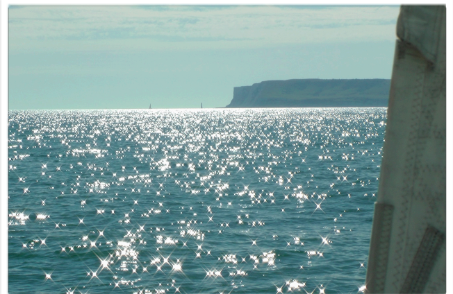
Beachy Head bei Eastbourne

Nach einem Regentag segeln wir hinüber nach Dünkirchen . Mit dem Strom brauchen wir bei SW 4 zwischen den vielen Containerdampfern und Fährschiffen hindurch für die 42 sm nur 5 Stunden. Weiter geht es ins belgische Nieuwpoort , wo wir wegen Starkwind drei Tage bleiben. Der weitere Weg führt an der Westkapelle vorbei in die Osterschelde zu den alten Nordseestädtdchen Zierikzee und Willemstad , dann weiter über Maas und IJssel auf der Staande Mastroute östlich an Rotterdam vorbei nach Dordrecht und Gouda, wo gerade der wöchentliche Käsemarkt stattfindet. Schließlich starten wir in einer Gruppe von 20 Booten kurz nach Mitternacht zu einer nächtlicher Grachtenfahrt durch Amsterdam . Im Sixhafen liegen wir gut vertäut, während ein verfrühter Herbststurm etliche Bäume an den alten Kanälen stürzten lässt. Trotzdem erkunden wir natürlich die lebendige Grachtenstadt ausgiebig zu Fuß und per Rad.