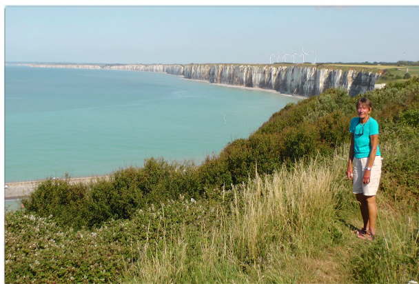
Die über 100 m hohe Alabasterküste erstreckt sich am Ärmelkanal von Le Havre aus 130 km weit nach Nordosten. In Felseinschnitten liegen die malerischen Orte Fécamp, St. Valery en Caux, Dieppe und Le Tréport.