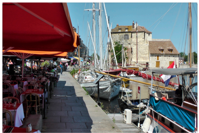
Der beschauliche Hafen von Honfleur am südlichen Ufer der Seine.

Alabasterküste. Die Nachbarorte Le Tréport und Mers de Bains gefallen uns so gut, dass wir drei Tage bleiben. Schön gelegen zwischen den 100 m hohen Kreidefelsen und mit gut gepflegten bunten Balkonhäusern aus der Belle Epoque. Der Strand besteht aus großen runden Kieselsteinen. Der Tidenhub beträgt 7 bis 9 m, so dass man nur bei Hochwasser ein- und auslaufen kann.