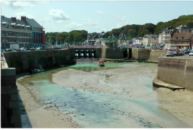
Die Hafeneinfahrt von St. Valery en Caux bei Niedrigwasser. Bei 8 m Tidenhub öffnet die Schleuse zum Fischer- und Segelhafen um die Hochwasserzeit nur für drei Stunden. Die Tour de France führt über die Schleusenbrücke.